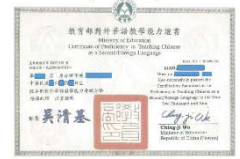
プロの資格を持つ講師在籍