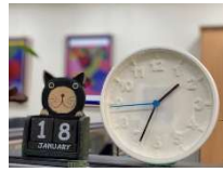
好きな時間帯を選んで受講する