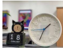
自己選擇時間上課