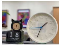
好きな時間帯を選んで受講する