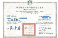
プロの資格を持つ講師在籍