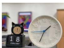
自己選擇時間上課